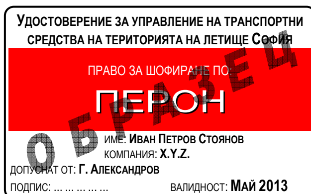
Фигура 1: Вид на удостоверението за шофиране според допуска до зоните за движение